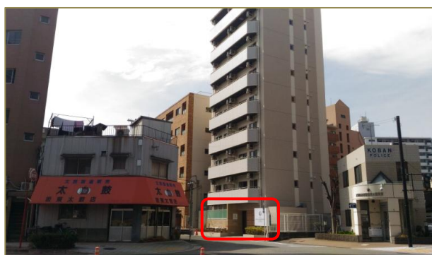
6 インターホンを押して、お入りください。