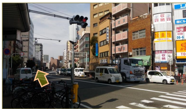
4 西に向かって歩道を直進してください。