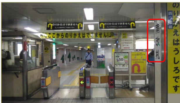
1 南改札口を出て、直進してください。