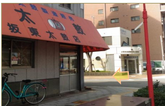
5 坂東太鼓店を過ぎて、交番が見えたら 左に曲がってください。